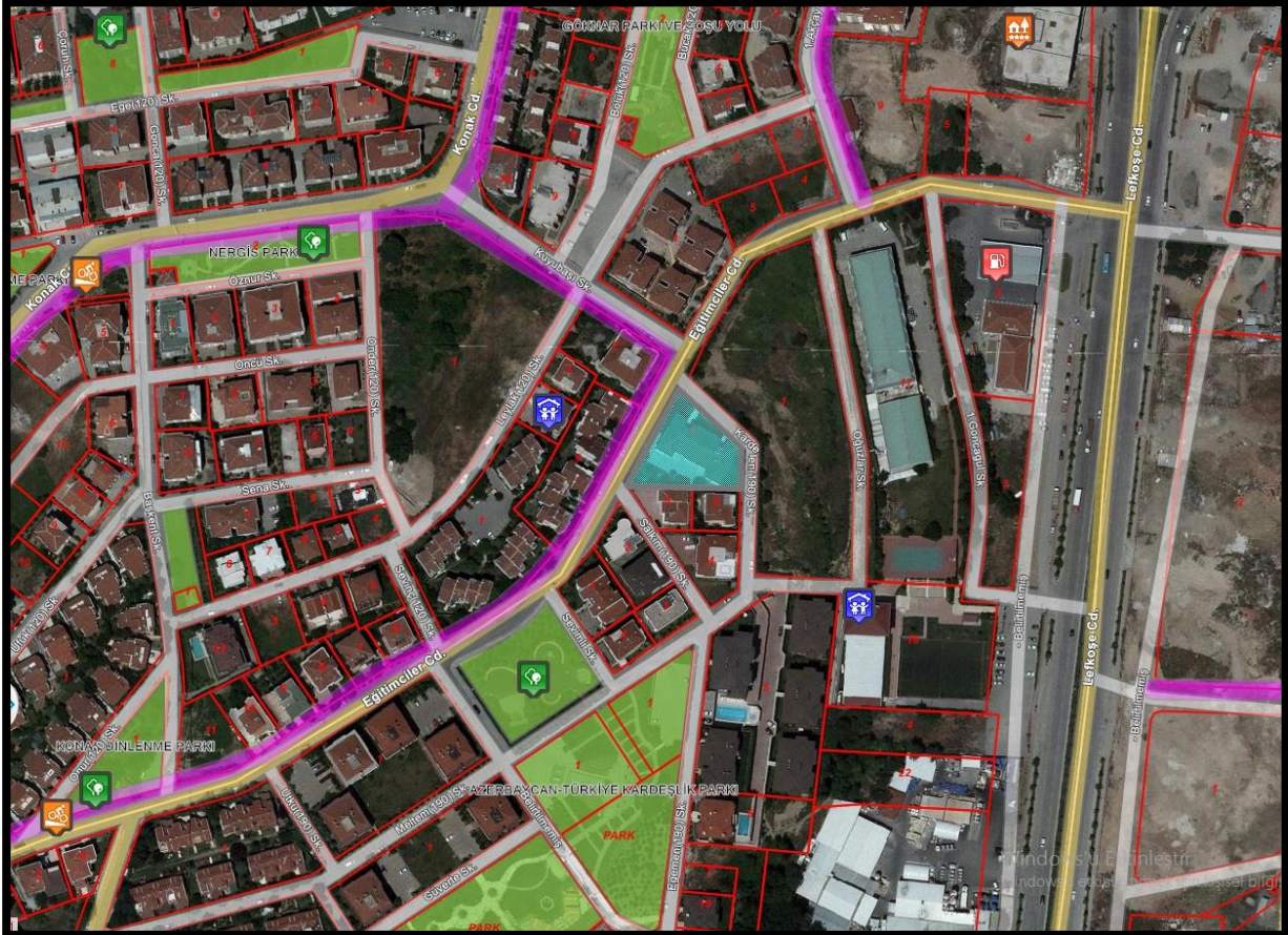
Şekil 1: Planlama Alanının Bölge İçerisindeki Konumu

Bursa İli, Nilüfer İlçesi, Çamlıca Mahallesi'nde bulunan yaklaşık 1481,05 m 2 büyüklüğünde olan planlama alanı yakın çevresinde ağırlıklı olarak konut alanları, eğitim alanları, yeşil alanlar ve ticaret alanları bulunmaktadır.