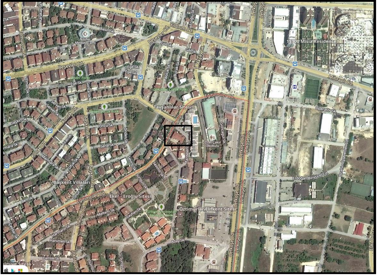
Şekil 2: Planlama Alanının Ulaşım İlişkileri